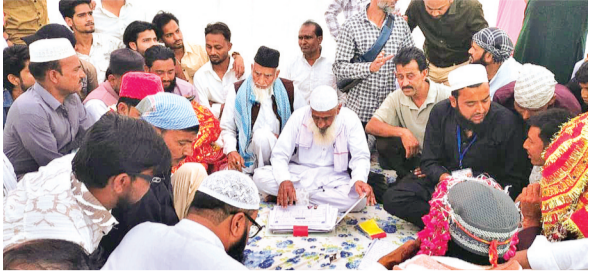
हरिभूमि न्यूज़ २२शुओपुर