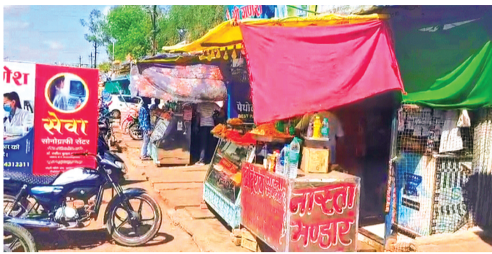
सुरक्षा व्यवस्था के लिए पुलिस बल भी तैनात रहा।