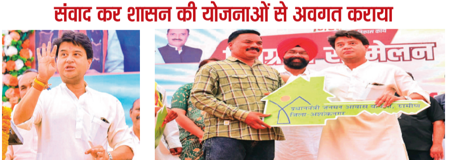
हरिभूमि न्यूज अशोकनगर

केंद्रीय संचार एवं पूर्वोत्तर क्षेत्र विकास मंत्री तथा गुना सांसद ज्योतिरादित्य सिंधिया ने अशोकनगर विधानसभा के जनपद मैदान में आयोजित विशाल हितग्राही सम्मेलन में भाग लिया। इस अवसर पर उन्होंने हजारों हितग्राहियों से संवाद करते हुए उन्हें विभिन्न जन कल्याणकारी योजनाओं का लाभ प्रदान किया। कार्यक्रम में बड़ी संख्या में मातृशक्ति, युवा और ग्रामीणजन उपस्थित रहे, जिससे यह आयोजन जनविश्वास और सहभागिता का प्रतीक बन गया। इस दौरान उन्होंने 3 करोड़ से अधिक की परियोजनाओं का लोकार्पण एवं शिलान्यास किया।