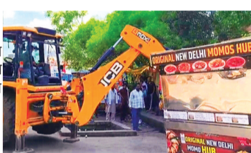
कलेक्टर विवेक श्रोत्रिय के निर्देश पर चलाया जा रहा यह अभियान शहर की यातायात व्यवस्था सुधारने, सड़क दुर्घटनाओं पर अंकुश लगाने और आम नागरिकों को सुगम यातायात सुविधा उपलब्ध कराने के उद्देश्य से चलाया जा रहा है।

कलेक्टर विवेक श्रोत्रिय के निर्देश पर चलाया जा रहा यह अभियान शहर की यातायात व्यवस्था सुधारने, सड़क दुर्घटनाओं पर अंकुश लगाने और आम नागरिकों को सुगम यातायात सुविधा उपलब्ध कराने के उद्देश्य से चलाया जा रहा है। प्रशासन का मानना है कि अतिक्रमण हटाने से सड़कों की चौड़ाई बढ़ेगी, जाम की समस्या कम होगी और दुर्घटनाओं में भी कमी आएगी। प्रशासन की इस सख्त कार्रवाई से यह स्पष्ट संदेश दिया गया है कि अब सड़कों और फुटपाथों पर अतिक्रमण किसी भी स्थिति में बर्दाश्त नहीं किया जाएगा। नियमों का उल्लंघन करने वालों पर इसी तरह सख्त कार्रवाई आगे भी जारी रहेगी और शहर को अतिक्रमण मुक्त बनाने के लिए अभियान लगातार चलाया जाएगा।