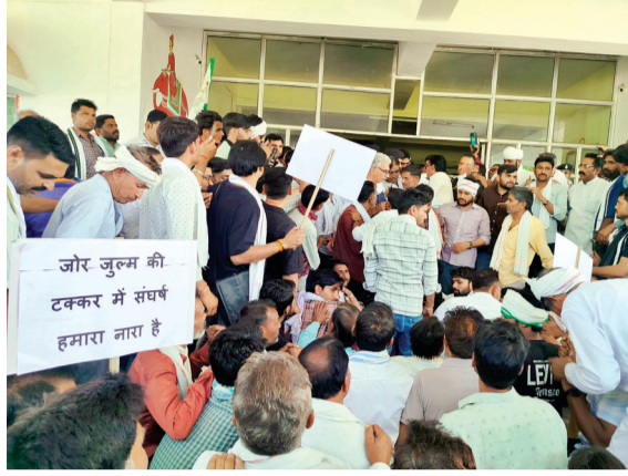
हरिभूमि न्यूज़ २२शुओपुर